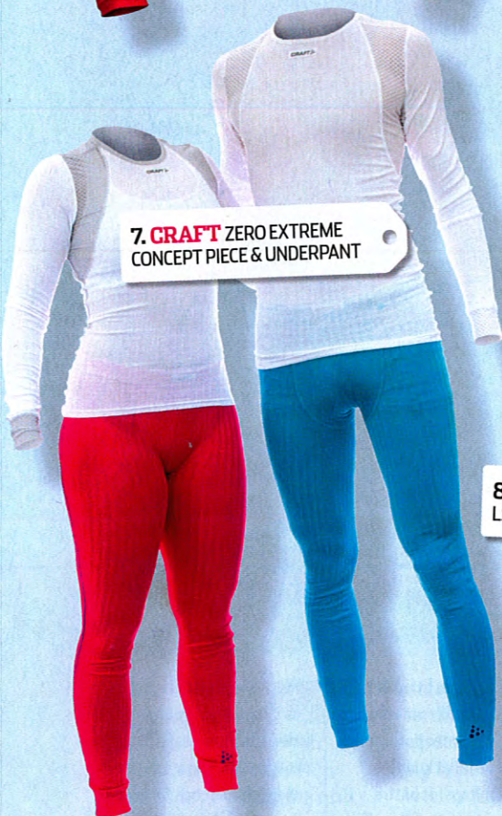
7. CRAFT ZERO EXTREME CONCEPT PIECE & UNDERPANT

7 Omdöme: Testets klart lättaste och luftigaste underställ. Perfekt för de intensivaste löppassen. Har stora ventilerade partier som kyler huden mycket effektivt där det behövs. Passformen är bra och kroppsnära. Tröjan når också ner över höften. Material: Syntet Tvättråd: Vikt tröja: 102 g (M Herr) Värmande effekt: (1-3) 1 Hemsida: craft.se Cirkapris: 500 kr för tröjan, 400 kr för byxorna. Betyg: 9 Rekomenderas!