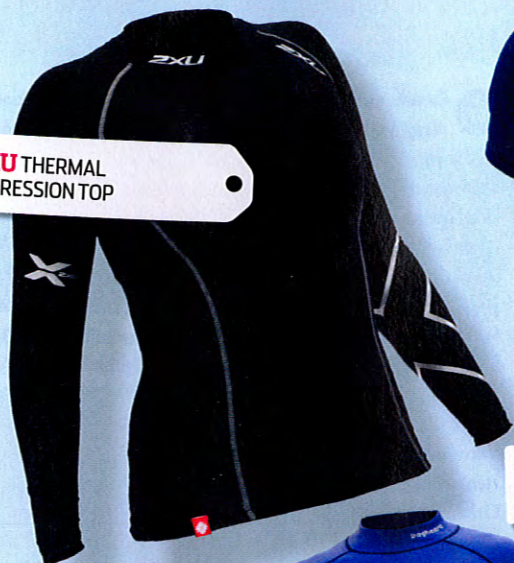
1. 2XU THERMAL COMPRESSION TOP