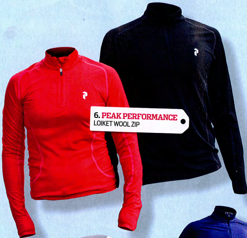
6. PEAK PERFORMANCE LOIKET WOOL ZIP

6 Omdöme: En tunn, något stickig ulltröja med snygg design. Tröjan är smal men något oförljamsam, vilket gör att den absorberande funktionen blir nedsatt. Dragkedjan är bra när man vill svalka sig snabbt. Material: 65% Merinoull 35% Mineral Tvättråd: (skonsam) Vikt tröja: 172 g (M Herr) Värmande effekt: (1-3) 2+ Hemsida: peakperformance.se Cirkapris: 900 kr Betyg: 6