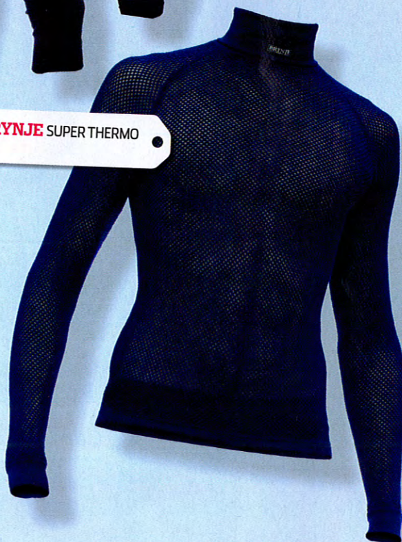
5. BRYNJE SUPER THERMO POLO