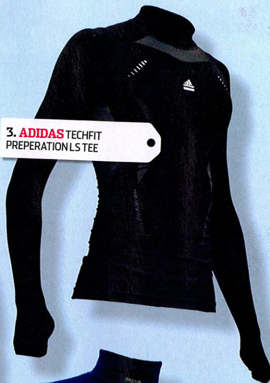
3. ADIDAS TECHFIT PREPERATION LS TEE