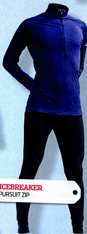
8. ICEBREAKER LSPURSUIT ZIP

9 Omdöme: Innan man riktigt varmt upp känns materialet lite väl plastigt, men när man väl blivit varm är understölet varmt och skönt. Passformen är bra, och tröjan är lång i ryggen. Ärmarna är dock lite långa. Material: Syntet Tvättråd: Vikt tröja: 169 g (M Herr) Värmande effekt: (1-3) 2 Hemsida: newlinesport.com Cirkapris: 400 kr /del Betyg: 7