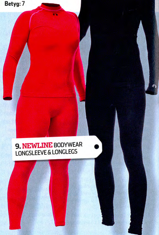
9. NEWLINE BODYWEAR LONGSLEEVE & LONGLEGS