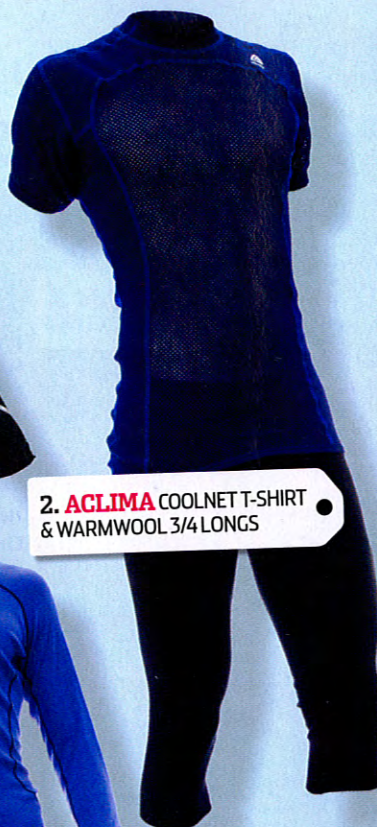
2. ACLIMA COOLNET T-SHIRT & WARMWOOL 3/4 LONGS