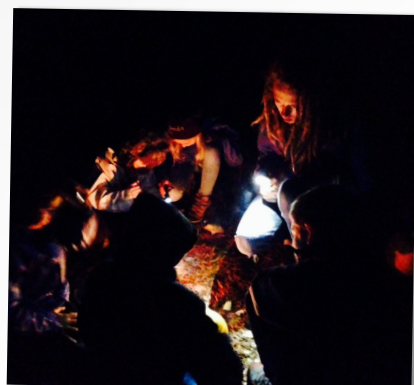
EPLESTEKING PÅ BÅL