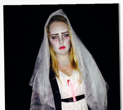
SKUMLERIER PÅ HALLOWEEN