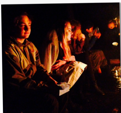
HØYTLESNING VED BÅLET

Til sist: Vi har oppnådd merket MATAUK og har vært på tre overnattingsturer! Godt jobbet, alle!